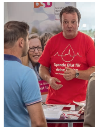
Herr Alpen informiert zur Blutspende