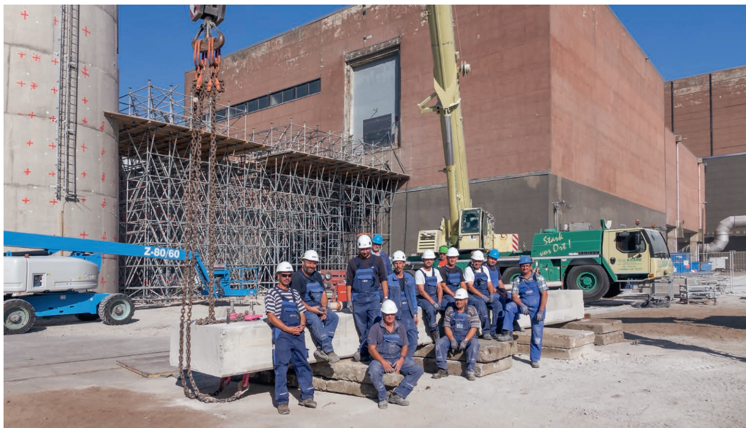
Der Rückbau des PE 302 ist geschafft – Die Kollegen der Demontage