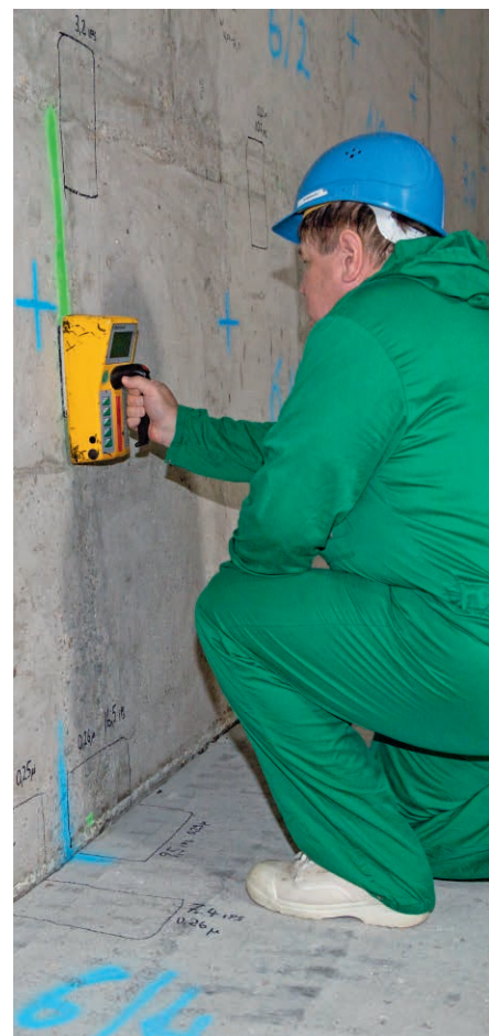
Radiologische Messung im Spezialgebäude 2

Unser Standort wird sich auch weiterhin verändern. Neben den Planungsarbeiten für die Zerlegehalle und dem Ersatzlager für die Halle 8 wird uns der Bau einer externen Abluftanlage für den Block 5 und das Gemeinsame Spezialgebäude (GSG) weiter beschäftigen. Für den Bau der externen Abluftanlage hat die beauftragte Firma mit der Erstellung der Vorprüfunterlagen begonnen.