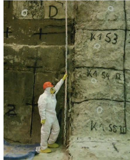
Demontage der Einbauten der Sylphonventile und Vermessung der Restbaustuktur

Vor Beginn der Demontage der Einbauten der Sylphonventile wurden alle Pumpenwächter des Systems auf Wasserfreiheit kontrolliert. Danach erfolgte die Demontage der Ventileinbauten und weiterführend der Verschluss von Rohrleitungsdurchführungen in den Montejsräumen. Der weitere Abbruch erfolgt entsprechend festgelegter Abbruchgrenzen.