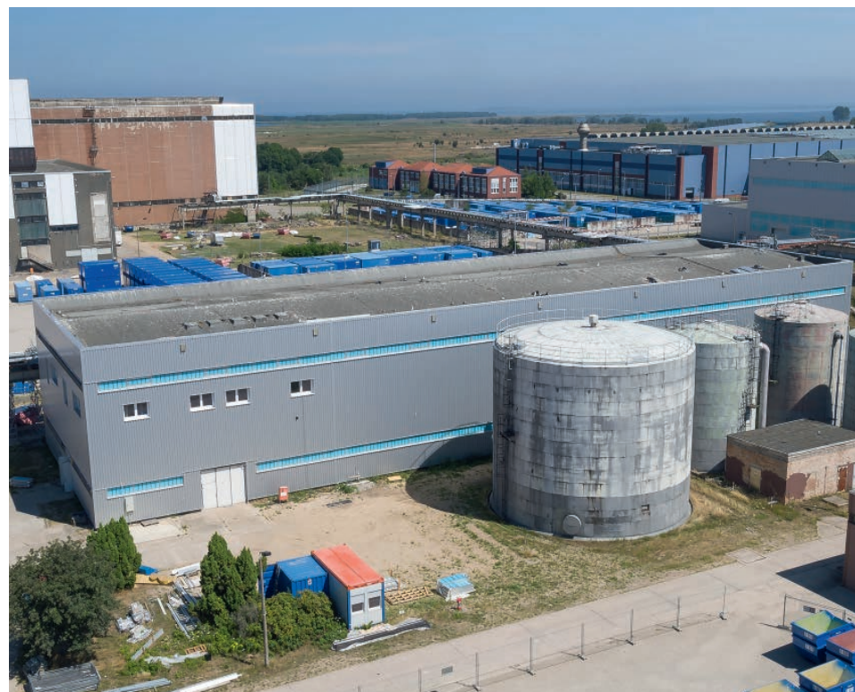
CWA (Chemische Wasseraufbereitungsanlage)

Die Umbauten der beiden Anlagen greifen eng ineinander. Im Rahmen des Reststandortkonzepts soll die ZSA ab 2021 mehrere Arbeitsplätze zentral zusammenfassen und den Arbeitsschwerpunkt weiter nach Osten verlagern. Voraussetzung für diesen Umbau ist die Räumung der ZSA und die Umsiedlung einiger Einrichtungen und Arbeitsplätze in die CWA. Wichtige Einrichtungen wie der Fuhrpark, das Quellenlager aus dem BGB, alle Werkstätten und Büros aus der Shedhalle, der Winterdienst und der Wareneingang werden nach dem Umbau in der ZSA zu finden sein. Außerdem werden mit diesem Umbau weitere Büroflächen geschaffen.