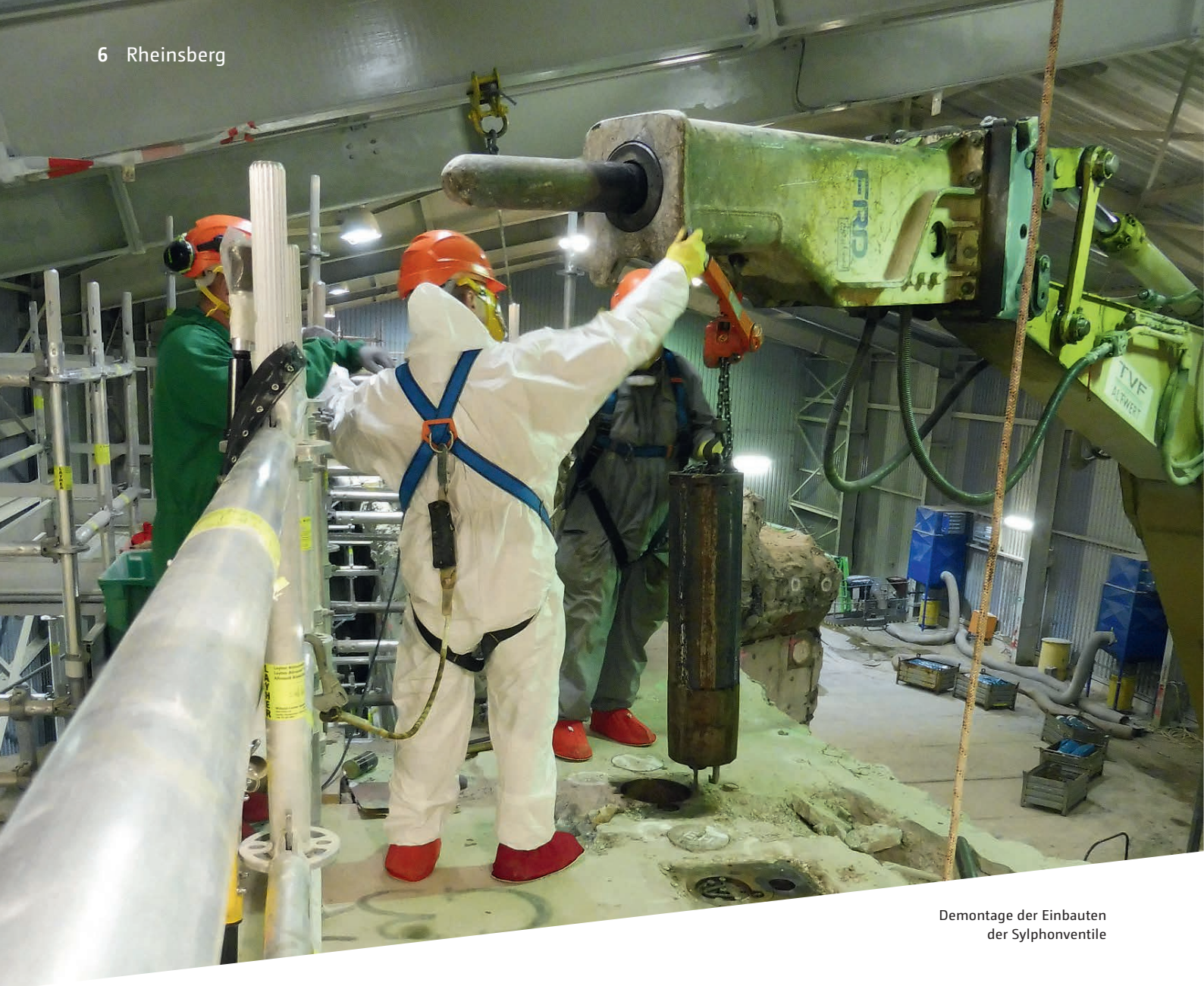
Demontage der Einbauten der Sylphonventile