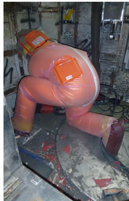
Heraustrennen der Raumauskleidung in der Heißen Zelle