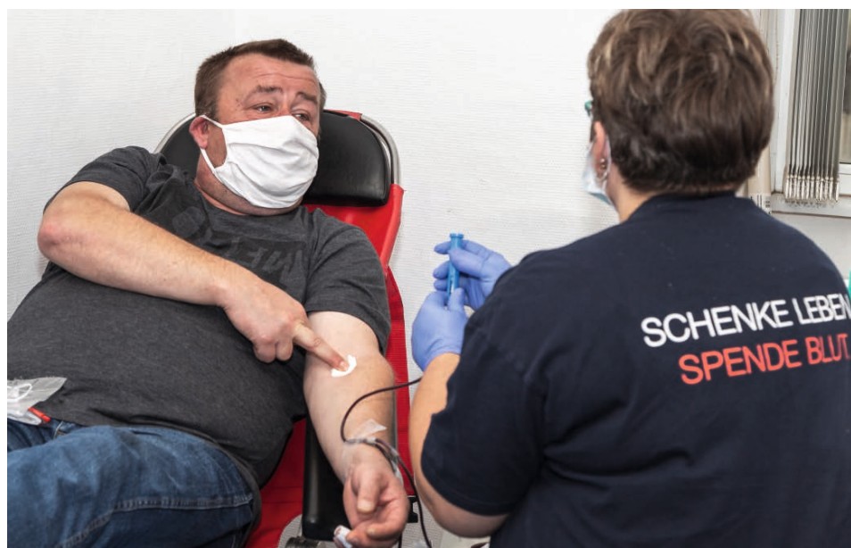
Blutspendeaktion des DRK