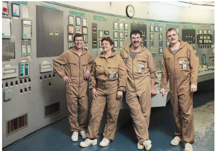
ehemaliger Arbeitsplatz Apparatehauswarte