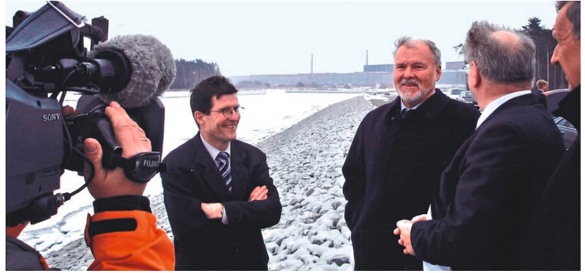
2006 – Besuch vom Ministerpräsidenten Harald Ringstorff