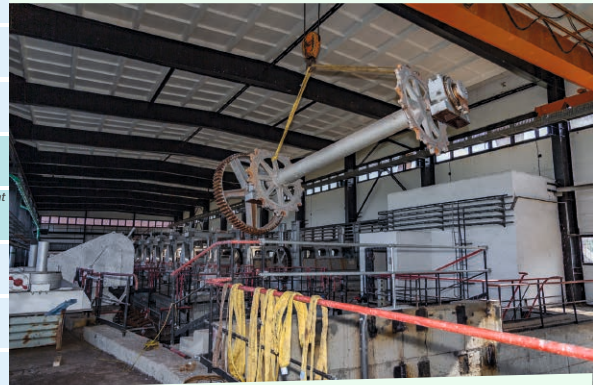
Demontage im Einlaufbauwerk 3