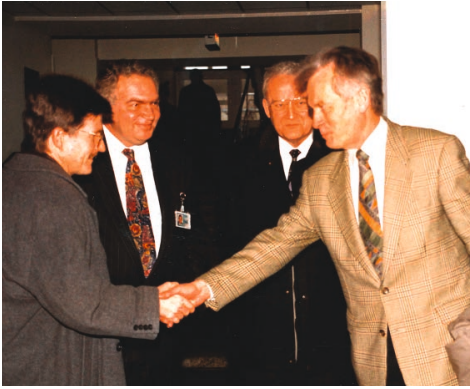
1995 – Besuch von Rudolf Geil – Innenminister MV