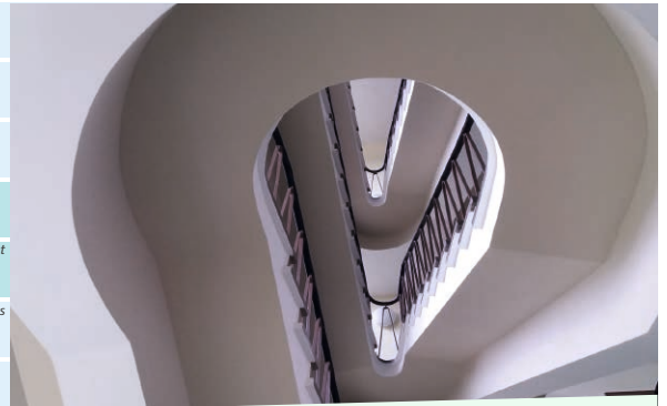
Treppenaufgang Verwaltungsgebäude BT Rheinsberg