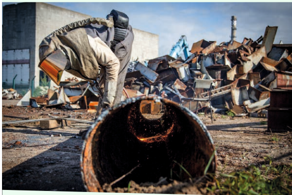
Zerlegearbeiten auf dem Schrottplatz