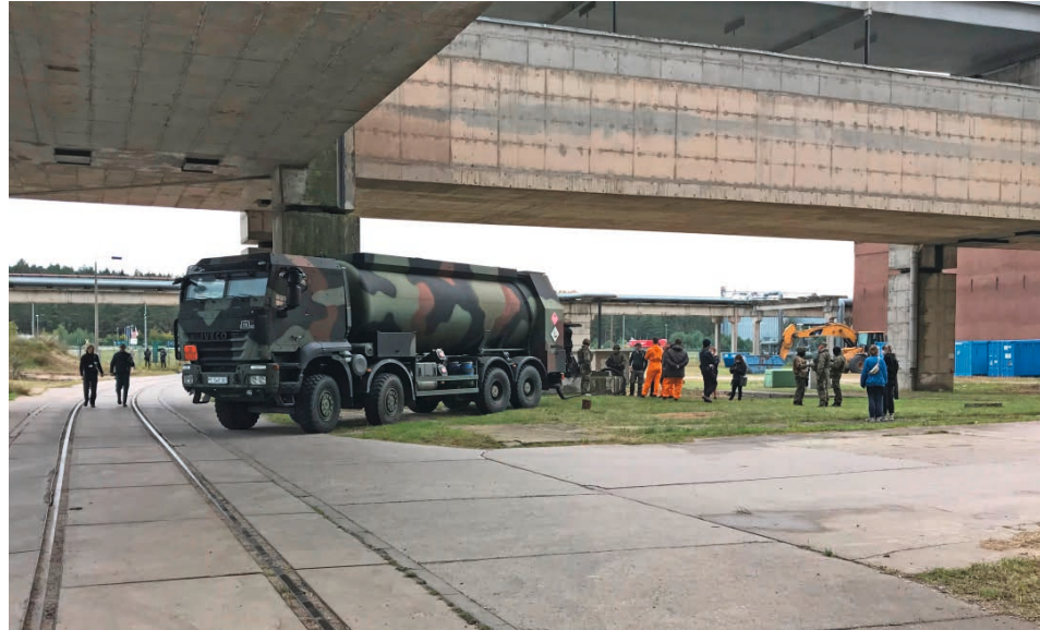
Betankung mit Diesel vor Block 6

Auch für den Objektsicherungsdienst war der Dreh eine Herausforderung, denn es mussten über 90 Ausweise und Zutrittsgenehmigungen erstellt werden, damit sich das Filmteam auf unserem Gelände bewegen durfte. Eine ständige Überwachung des Teams wäre durch die hohe Personenzahl nicht leistbar gewesen.