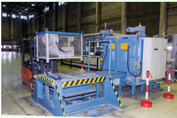
Materialbereitstellung für die Freimessanlage