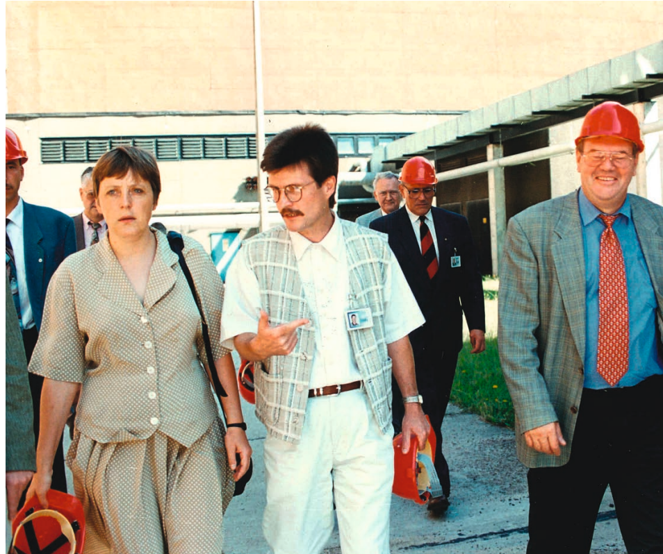
1995 – Besuch der Bundesumweltministerin Angela Merkel

Was ich vermissen werde: Dass meine notorisch norddeutsche Begrüßung stets mit einem ebenso ehrlichen „Moin“ erwidert wurde.