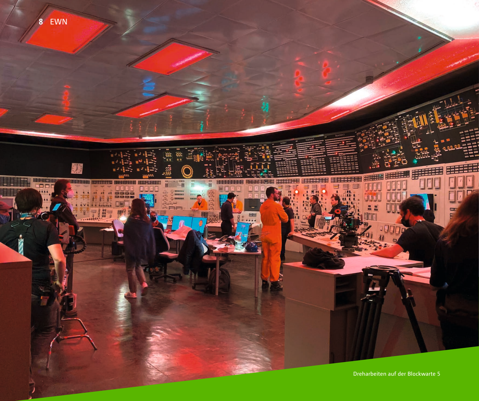
Dreharbeiten auf der Blockwarte 5