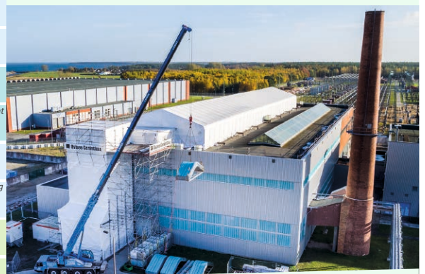
Montage neuer Oberlichter auf dem ZDW Dach