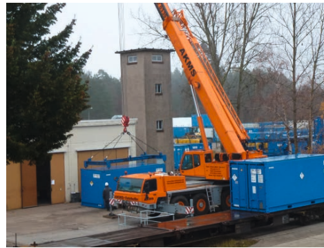
Beladung durch einen 90-Tonnen-Kran

Beim Verladen gilt es, ein genaues Ladeschema einzuhalten, das heißt es wird genau festgelegt, welche Container auf welche Waggons kommen. Dabei ist zu beachten, dass jeder beladene Container maximal 24 Tonnen wiegen darf und die Außenoberfläche kontaminationsfrei sowie unbeschädigt sein muss. Insgesamt werden bei diesem Transport ca. 150 Tonnen schwachradio-