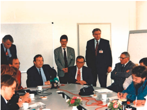
1994 – Treffen mit Bundeswirtschaftsminister G. Rexrodt