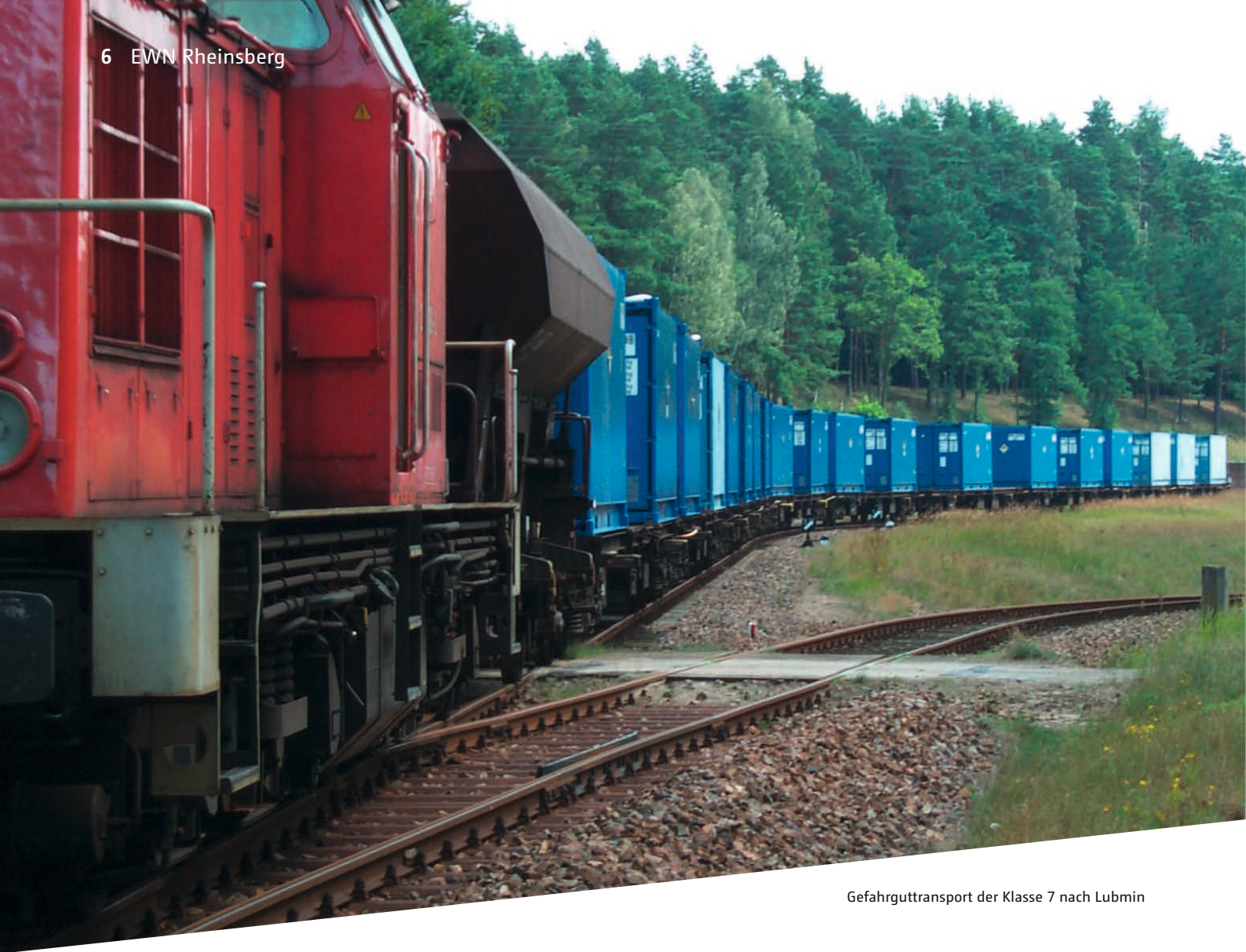
Gefahrguttransport der Klasse 7 nach Lubmin