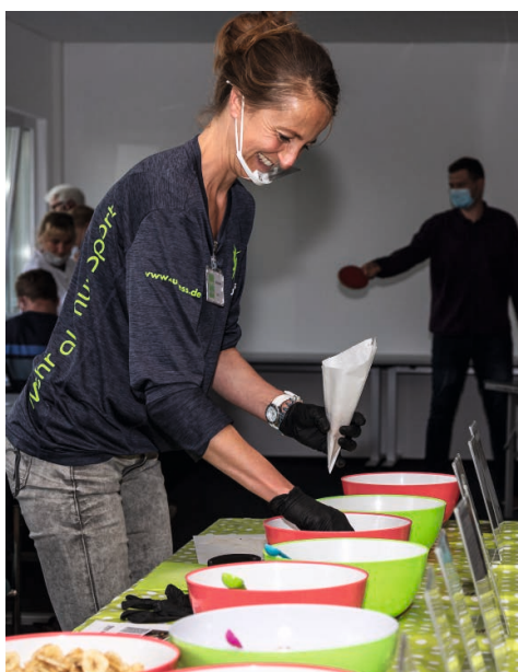
Brain Food Buffet