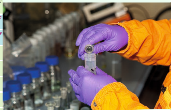
Probenuntersuchung im Chemielabor