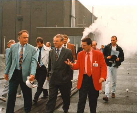
1993 – Besuch von Dr. Berndt Seite Ministerpräsident MV