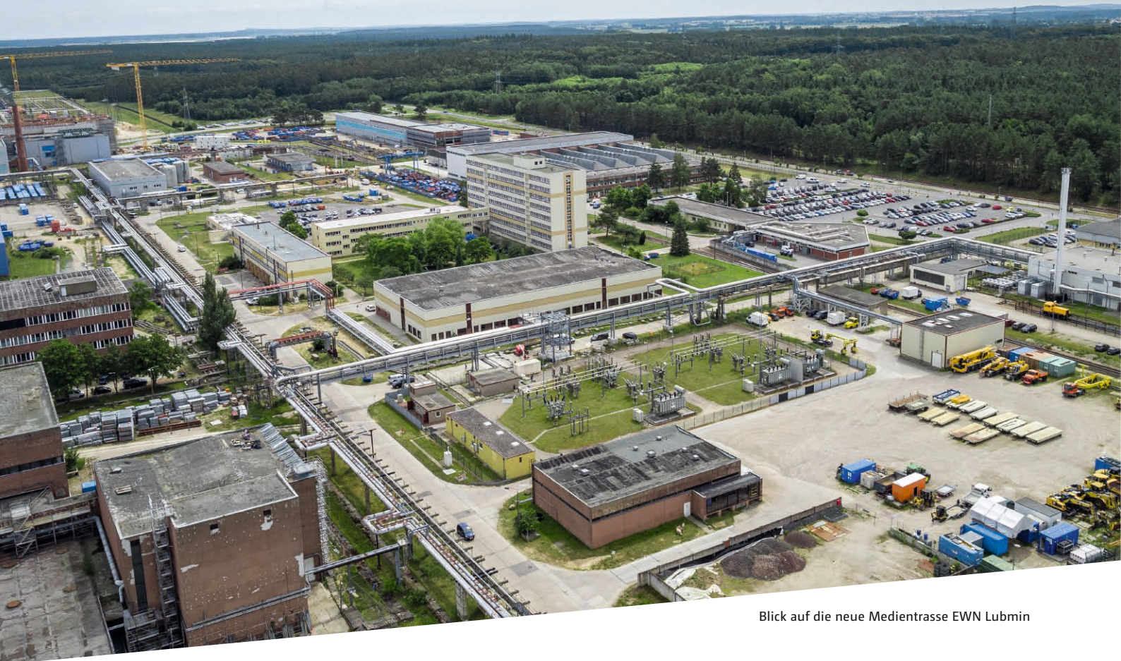
Blick auf die neue Medientrasse EWN Lubmin