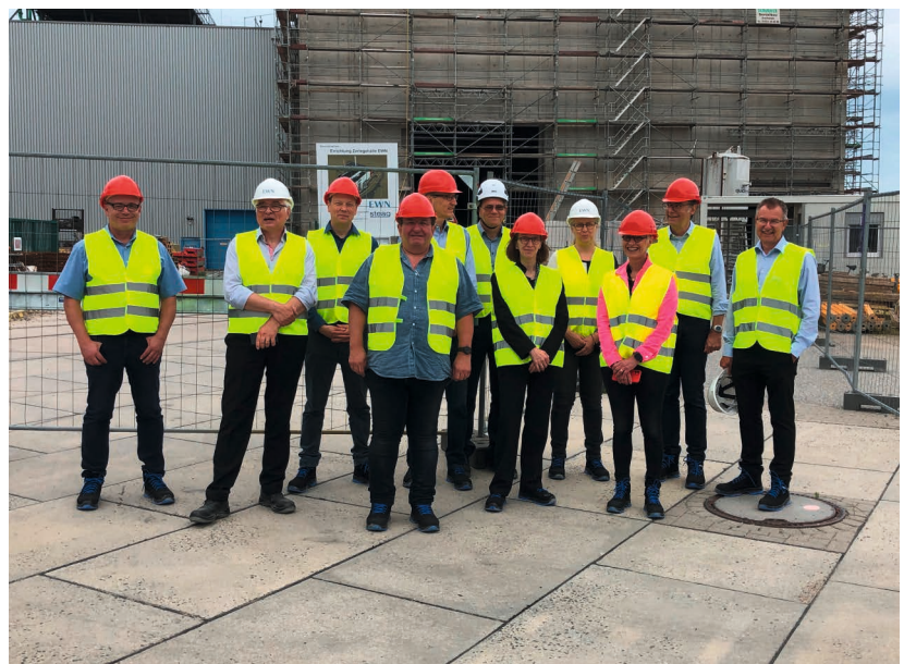
Auch der Aufsichtsrat überzeugte sich vom Baufortschritt der neuen Medientrasse.

Am 25. Juli wurde die Überprüfung des Rohrverlustfaktors der Kamininstrumentierung des Kamin Nord III erfolgreich durchgeführt. Für die Zeit zwischen Erst- und Wiederholungsprüfung wurde die Fortführung von Arbeiten in Block 5 und GSG durch Anwendung eines konservativen Gesamtverlustfaktors in der Kamininstrumentierung des Kamin Nord III ermöglicht. Das Vorgehen erfolgte nach enger Abstimmung und Genehmigung durch das LM M-V.