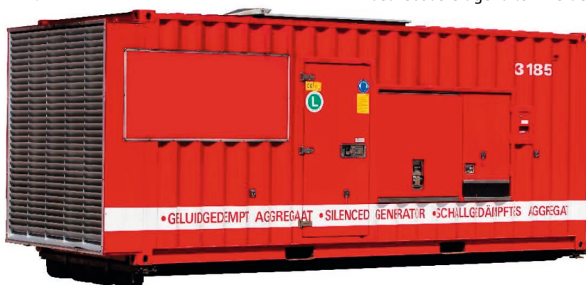
Eines der geplanten Dieselaggregate der ext. NEA

Die ext. NEA wird aus zwei identischen Dieselaggregaten versorgt. Diese sogenannte Tandem-Lösung ermöglicht dann einen unkomplizierten Wechsel zwischen den parallel geschalteten Aggregaten der ext. NEA.