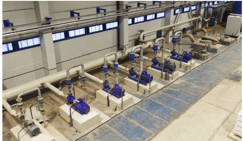
Rückbau der Trinkwasserpumpe

Der Rückbau der Trinkwasserpumpe 026/1 wurde mittels einer Änderungsanzeige beantragt. Diese Trinkwasserpumpe war für die Aufrechterhaltung des Drucks im TBF-Netz zu