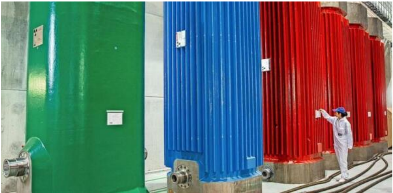
Bild: Eine Mitarbeiterin prüft im vorpommerschen Lubmin im Zwischenlager die Lagerprotokolle an Castorbehältern, die als Abschirmbehälter für schwach- und mittelradioaktive Abfälle genutzt werden.

Nach Einschätzung von Damm wäre Lubmin mit seiner langfristigen Expertise beim Rückbau und der Aufbewahrung von Castoren prädestiniert für begleitende Forschungen zur verlängerten Zwischenlagerung. Im dortigen Zwischenlager Nord (ZLN) lagern allein fünf verschiedene Castorentypen – alle mit einem möglicherweise unterschiedlichem Langzeit- und Transportverhalten, so Damm.