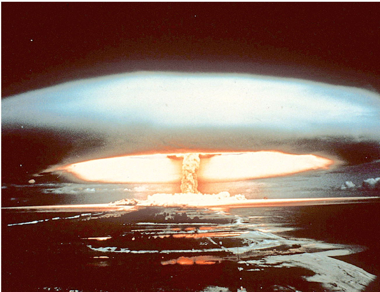
Bildunterschrift: Atompilz über Mururoa-Atoll im Südpazifik 1970: Teile des Abfalls werden Jahrtausende strahlen