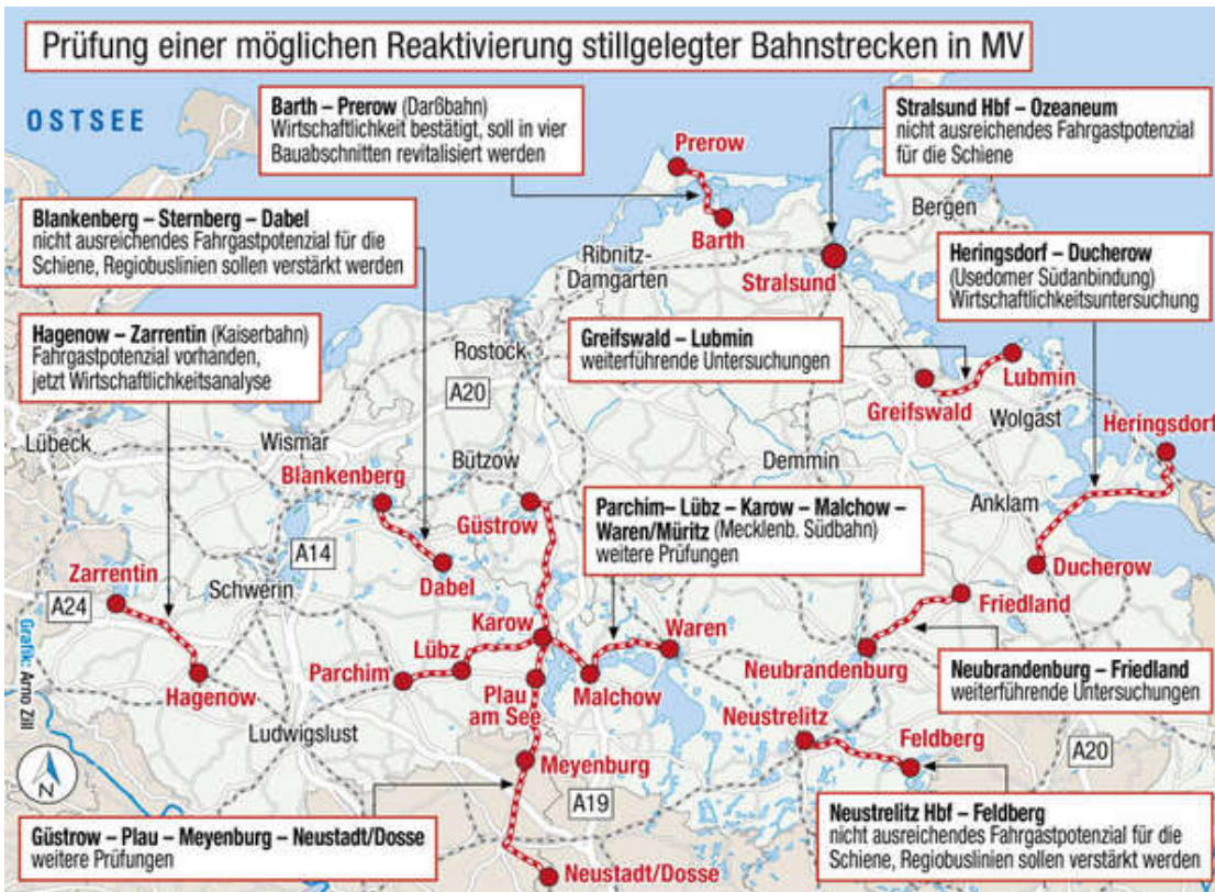
Eine Reaktivierung stillgelegter Bahnstrecken in MV zur besseren Anbindung an Brandenburg wird geprüft.